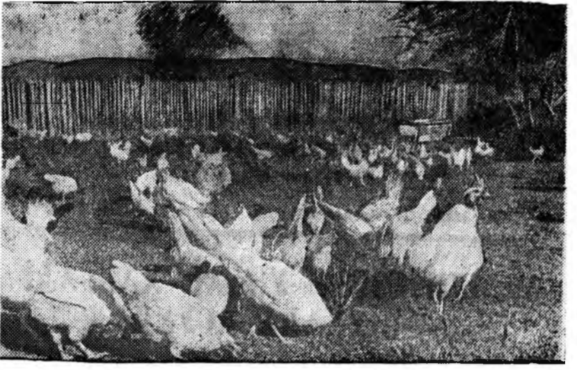
XVIII партсъездын нэрэмжэтэ колхозой (Селенгын аймаг) шубуунамай фермэ 486 толгой эхэ тахдаһаа 500 дальбарай абаба. ЗУРАГ ДЭЭРЭ: Тус колхозой шубуунамай фермэ дээрэ.