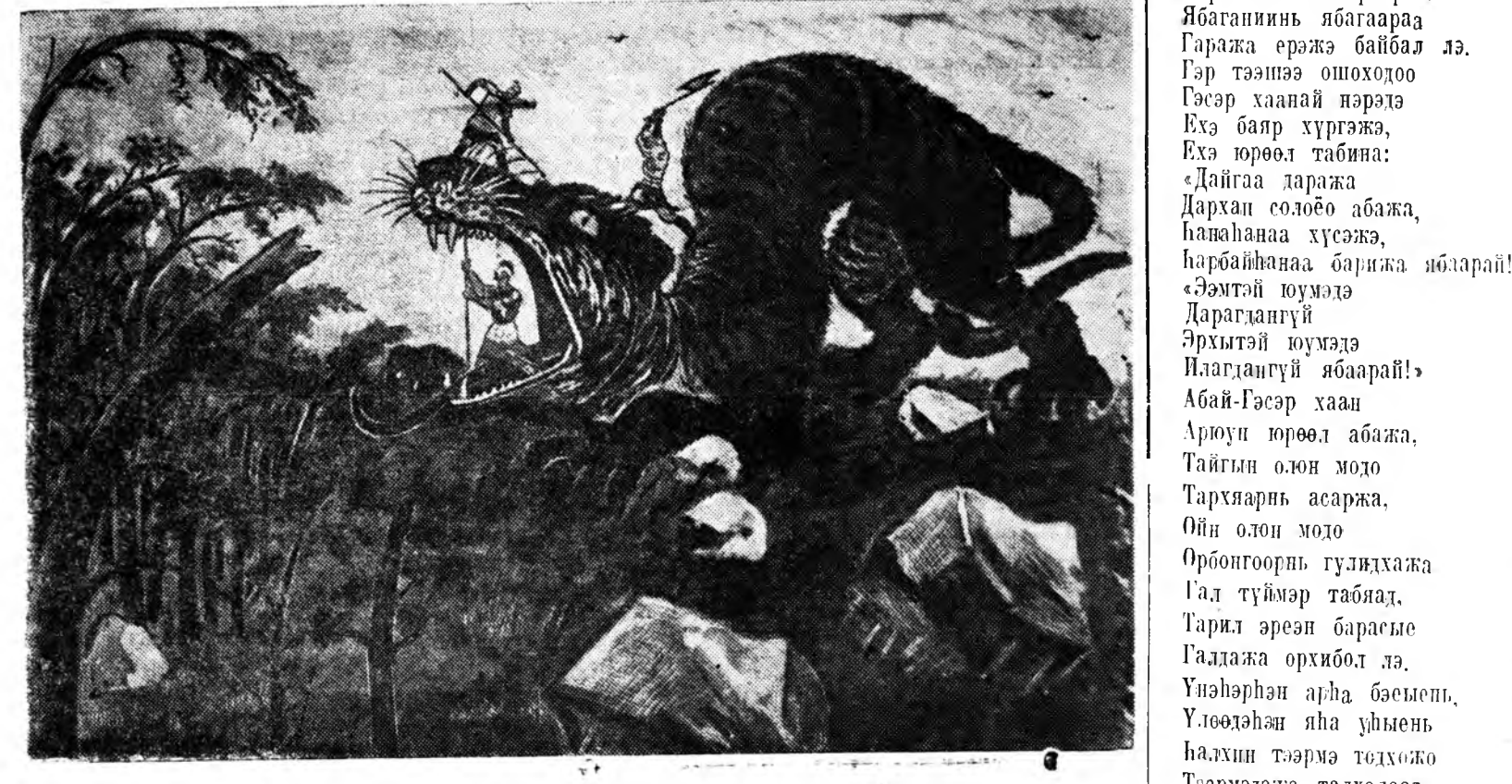
Тарил эрэн барастай дайгүлдэн Абай-Гэсэрэй дайн. ЗУРАГ ДЭЭРЭ: Абай-Гэсэр тарил эрэн барастай тангалайе жадаараа хадхажна байна. Барасай толгой дээрэ Гэсэрэй баатарнуу.

Гэсэрэй өөрын гайхамшата ябадал ба тэмээлүүдэй түүхэ оройнон байна. Хөөрхөн хойронь тэрэнэй хүүбүүд ба олон баатарнуудайн хэһэн багшата хэрүүлдэй түүхэнүд оройнон байха юм.