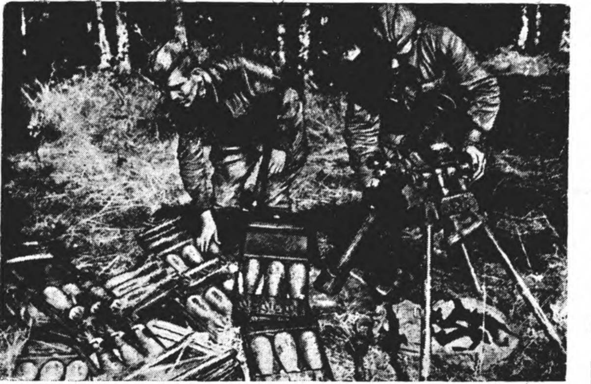
ЗУРАГ ДЭЭРЭ: Н. город шадар сухариха үедэ фашистуудай орхинон немецэ минометыг маныхид үзэжэ байна.