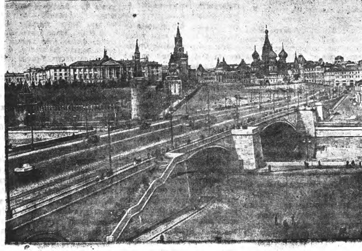
ЗУРАГ ДЭЭРЭ: Советскэ Союзай столица — Москва.