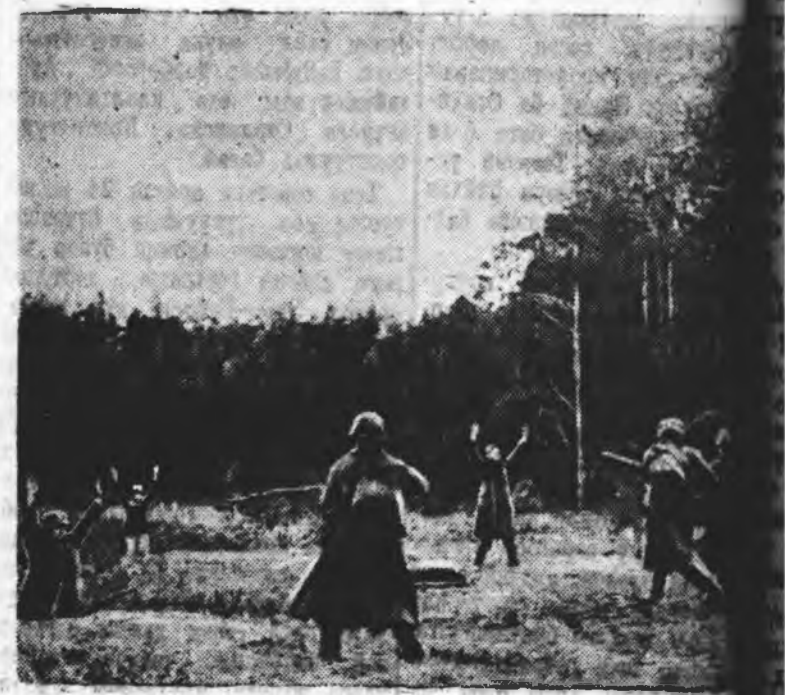
ДАЙЛАЛДАЖА БАЙГАА АРМИ. ЗУРАГ ДЭЭРЭ: Советскэ эхэнэрүүд атаман ороод, немцкэ солдатуудыг ялган яваха байна.