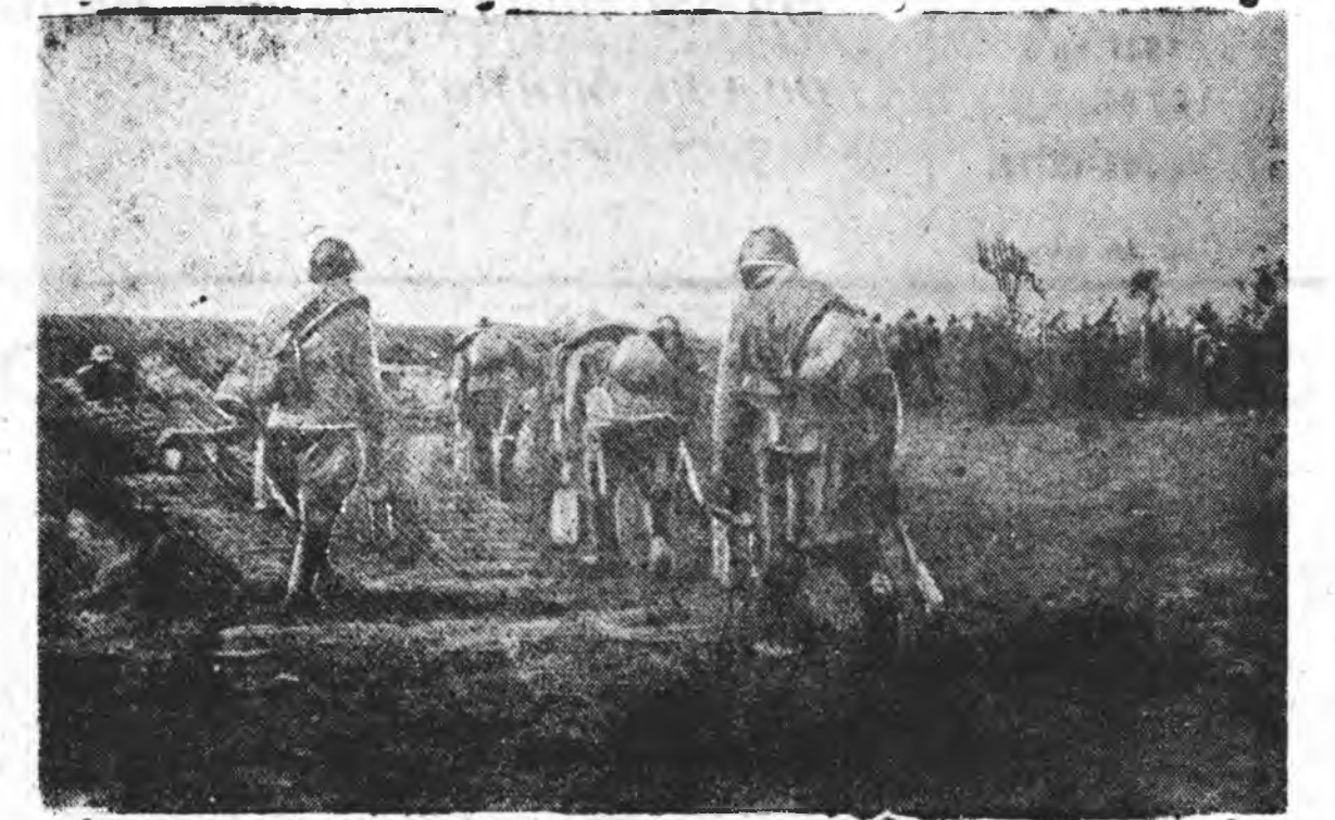
ЗУРАГ ДЭЭРЭ: Пулеметчигүүд байлдаанай түрүү линидэ ошоно ябана. (Баруун зүг).