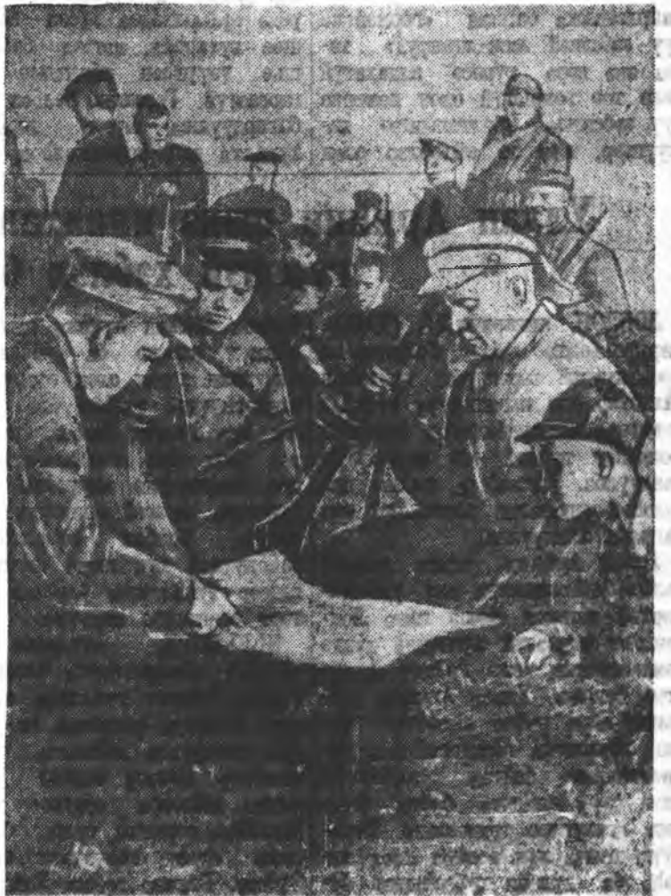
Дайсанай ара талада манай партизанууд дайшлын алуурчлал дүлгэмэ байна.

УНӨӨГӨӨ АБАГШАЛАЙМНАЙ ҮНЭН ХЭРЭГ ҮРЭЭ ҮГЭХЭ!