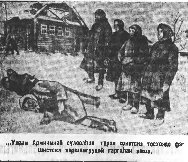
...Улаан Армийннай сүлөөлһэн түрэл советскэ тосхондо фашистскэ харшамгуудай гаргаһан аша.