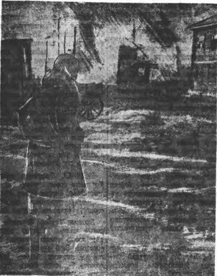
Гитлеровскэ алууршад ажана нуунан советскэ тосхонуудыг галдана...

● АЖАНА НУУНАН АУАДУУ ● ЗОНОЙМНАЙ ШУНАНИЙН ҮНӨӨНДЭ ДУУДАНА