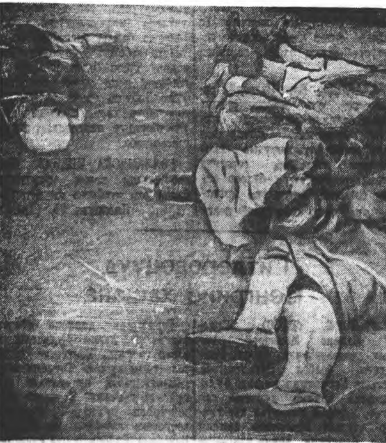
Харгыгаар лбаһан эхэнэр ба үхбүүдөөмнай хайра гамгүйгөөр буудан алана...