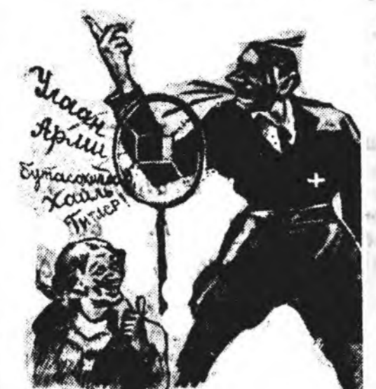
Батон Мионхуэнен: Хэтгэжэ мүлбэн дээр ядаб гэжэ, Хэдэн дайнда ядаб гэжэ...