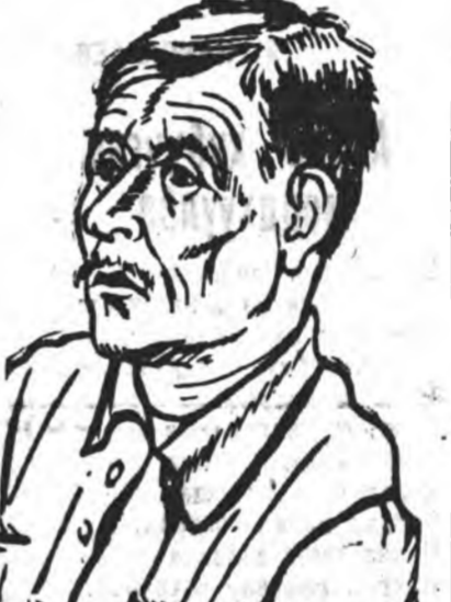
Имангай эршөнтэйгээр хүдэлмэ-ригэ.

Энэ зорилгоор манайхын огород дээрэ 2000 шарга шэжэ гаргаа, артын овош таримал тулаа парнигаа бэлэхтэй, рманууде түсөөрлэ, байна. Үсхэл ба оролдолоо гарган, үбгэн залуу