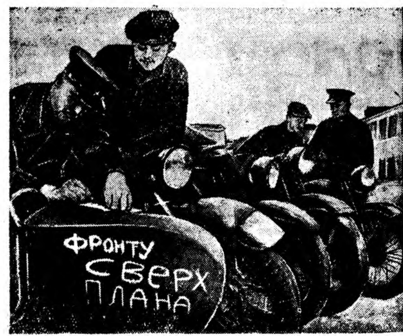
Зураг дээр: П-скэ заводоһ (Москва) түсбөөе гадуур бүтээн гарганы мотоциклууды Улан Аршин түлөөлөгшд тушаан абажа байна.

«Баяхан манай энэ нэгэ солдат эрээ. Энэ болбо фронт дээр шархатаһан байна юм. Амарла тунгаа түлээр дахин Россия ошохо ёһотой байһан байгаа. Мөрдөгшнөө урда дээр энэ солдат өөрылгөө гэрэ бээ бууджа үлдэе», — гэжэ Матвебурһан (Германь) немецкэ солдат Гергард Веберу гэгшөдө бөшөө.