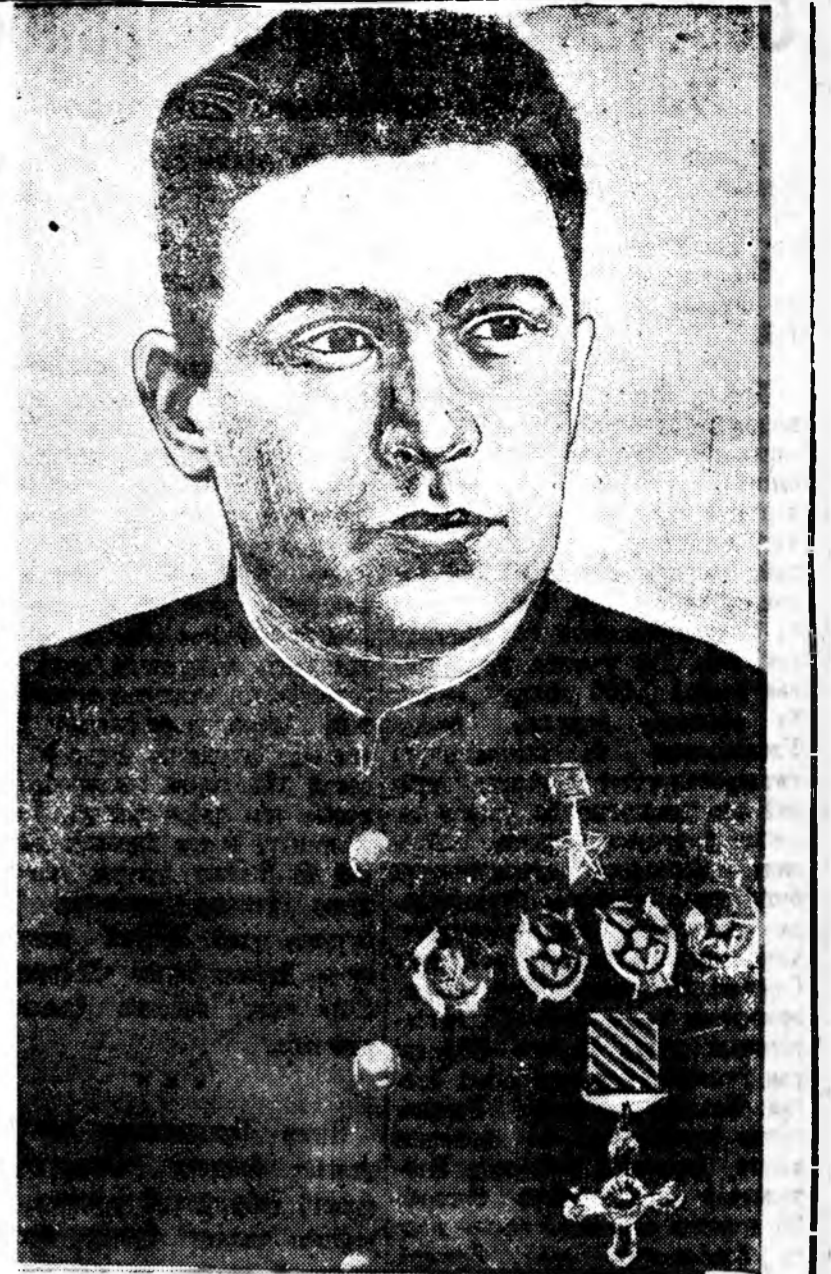
Хоёр дэжин Советскэ Союзай Герой Б. Ф. СИДОРОВ.