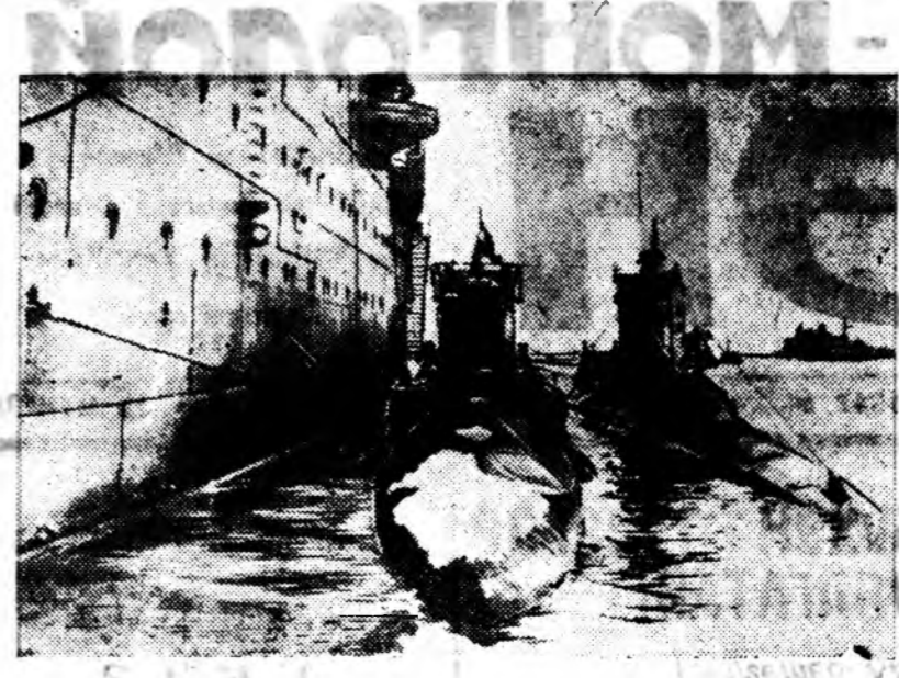
АНГЛИИНЫ УЯАН-СЭРЭГЭЙ ФЛОТ Зурга дээр: уяан доогуур ябадаг өгшөө уяада байна.