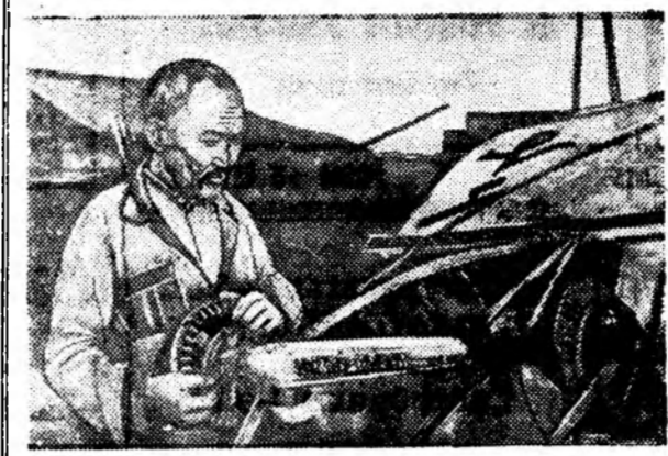
УНААН МАЛГАЙГАА АБАНГҮЙТӨӨР...