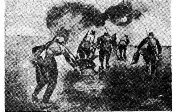
Н-скэ частши минометчигүүд шэнэ рubeждэ ошожо ябана.