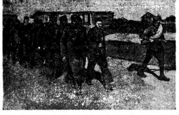
Плендэ абтан солдатүүдэ туужа ябана.