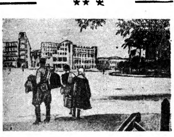
Дайсанай бомбо дойрагдан Сталинградтай үйлсэнүүдтэ.

шинатай үлэб. —14 снаряд үлөө,—гэжэ номологшо Суслов мэдэсэбэ. Танк бүридэ нэжэд снаряд хурэхэгүй үлөө байбашы хаан тэлэнэр дайшалхы зоринго алабагуй.