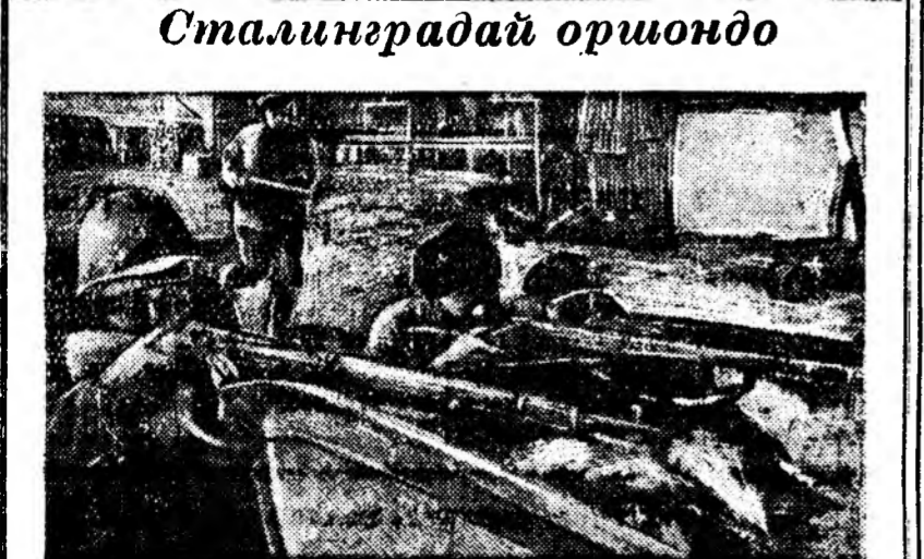
СТАЛИНГРАДАЙ ОРШОНДО ЗУРАГ ДЭЭРЭ: Хүдэлмэришөдэй батальонной бөсгүүд түрэд гөрөөлө хамгаалаа байна.

Октябриин кадрууд— советскэ арадай диллэлшөгү хүсэниинг мүн.