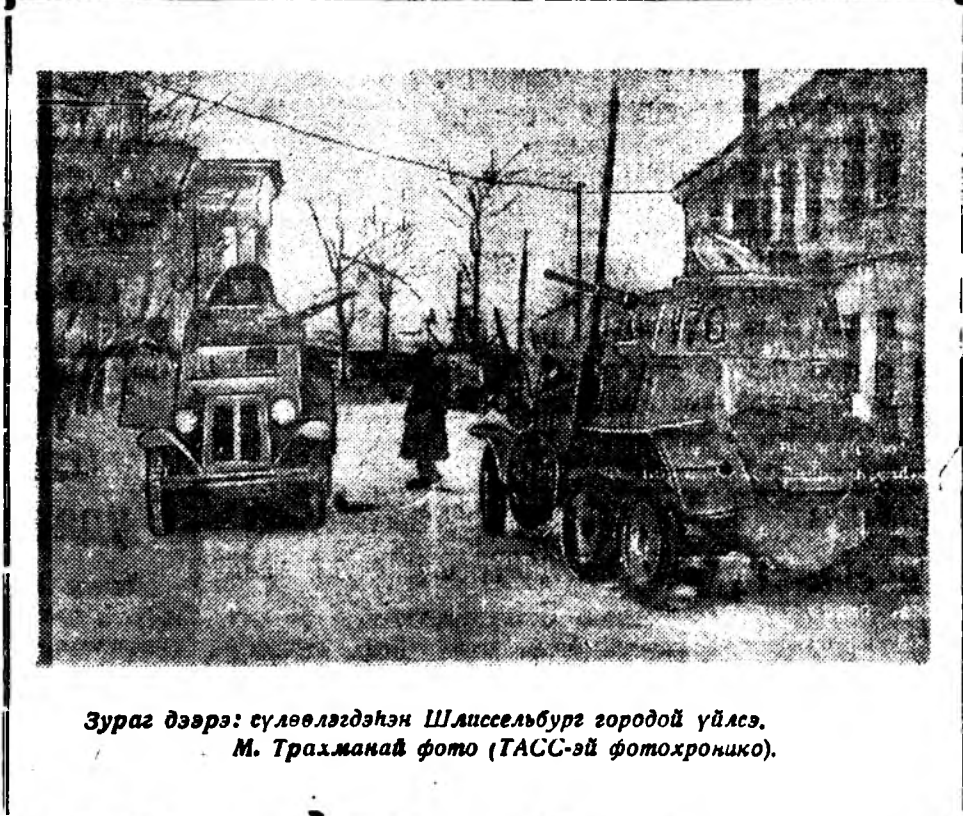
Зураг дээрэ: сүлөөлдэсэн Шоссельбург городой үйлэ.

Орловск областийн нэгэ райондо абуудалга хэжэ байсан отрядтай партизанууд январь бара соо дайсамай сэрэгтэй 4 эшелоние замбаа халлаан байла. 4 паровоз, 8 вагон, тэхникэ ба домо хэрэгсэлүүдтэй 17 платформ хиа бута сохиноо. Орловск партизануудай нүгөө нэгэ отряд нэгэ бууриг газарта немецкэ гарнизон ба бута сохёон байла. 60 гитлеровцэ алагдажа, Германияда элбэг хэбн тэрэ тархашалгад немецүүдэй бууриг абтаан манай үүсүтэ бууриг абтаа.