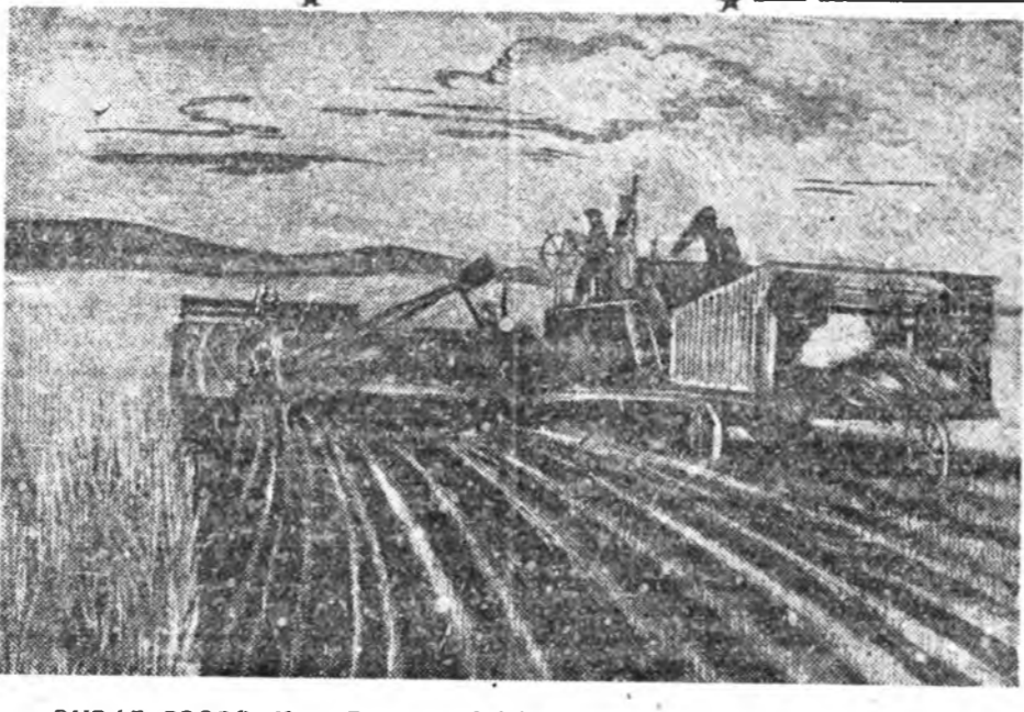
ЗУВАГ ДЭЭРЭ: Ново-Брянска МТС шеницээг хурмажа байна.