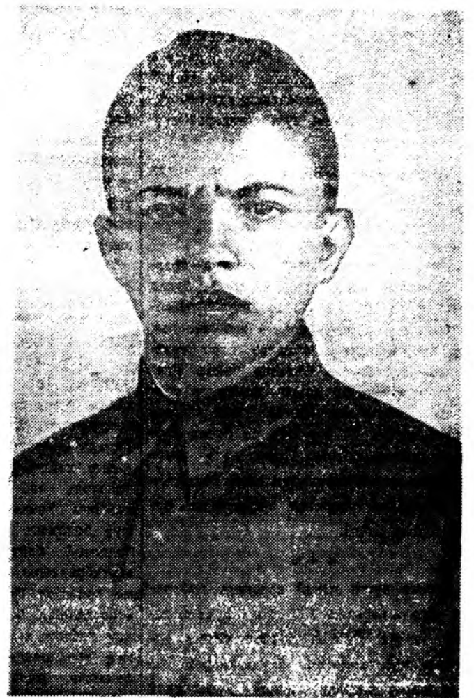
56-дахы Гвардейскэ буудалгын дивизиин 254-дахы Гвардейскэ буудалгын полкын гвардийн рядовой Александр Матросов 1943 оной февралдин 23-да Чернушкин гэдэ дөрвөннэй түлөө немецкэ-фашистска булмитарашадтай хэжэ байлдаанай шийхэхэ минутада дайсанай дэст тэжээ сүмэрэн ороод, өөрнөгөө бээр албаруурынь хаажэ найа баран ба тшигэжэ поградленцидэ амжалта туйлуулһан байна.

СССР-эй Верховно Советдэй Президиумэй 1943 оной июндин 19-эй Указар нүхэр Матросово Советскэ Союзай Геройн нэрзээргэ олоодоһон байха юм.