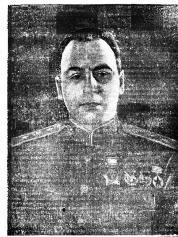
Суворовой I-дахн Үртын ордоной кавалер генерал-полковник А. И. АНТОНОВ.