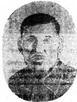
ционно хүдэлмэри һайнаар ябуулагдаа.

Хабарай тарилгын халуун хаһа сэг орохоо байна. Манай МТС-эй коллектив хүршэ нуугаа Саянтын МТС-эй коллективэй уряалаар Бүхэеспубликанска социальсөөндэ оролсоһон юм. Абаһан уялга тангаригаа нэрэ түрэтэйгөөр бэлдүүлхын тулала тракторнуудай заһабарине түбхын түрүүндэ улавоу гуримаар өмхидхэжэ, хүдэлмэришэдэйнгөө хүсье шадал зэргэ ба шадабарин мэргэжэлэйн хирээр хубаарилан таһан байнабди. Заһабарин үе соо олонийтын агита-