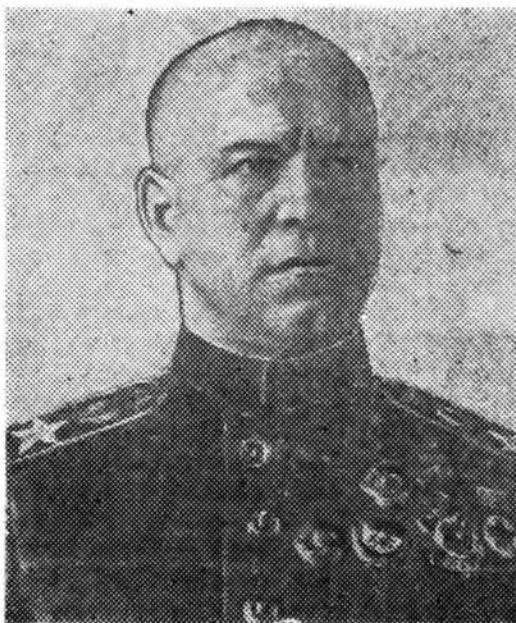
Советскэ Союзай Маршал Г. К. ЖУКОВ.