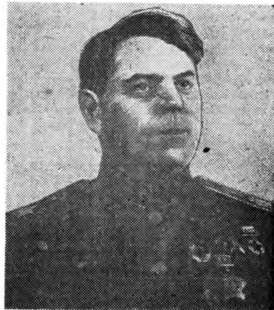
Советскэ Союзай Маршал А. М. ВАСИЛЕВСКИЙ.