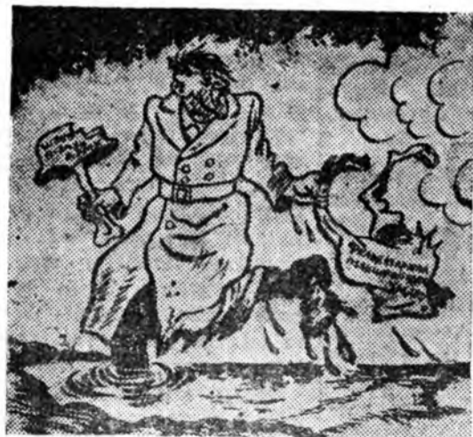
Гитлеровскэ командозанин: Гартга баатар бариха «Үлэгдэлнүүдын» хадаа Үмдэн малгай хоёр лэ.

«Германска верховно командозани хадаа германска сэрэгүүдэй үлэгдэлнүүдые хүтэлбэрлхэ ябадалаа гартгаа баатар бариха байна» гэжэ немецкэ мэдээн соо хэлэгдэнэ гэнэ.