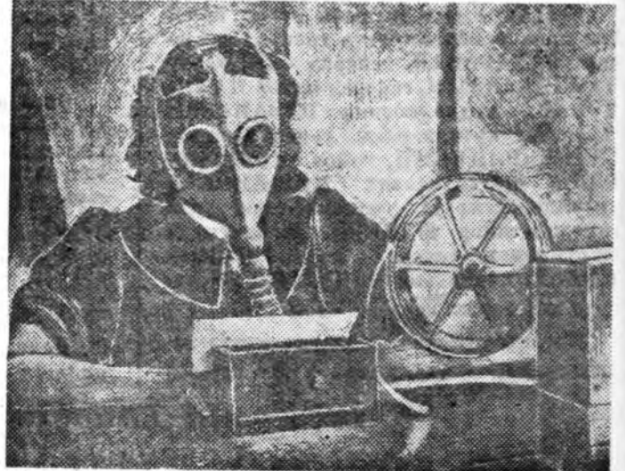
Улан-Удын телеграфай монитроодо противогазтайгаар хүдэлмэрилжэ байна.