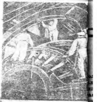
Сибирьтэхи алюминиевэ дой шөгөдхэн бүтээжэ под ашгайлалтада оруулагдаа.

дуудта добтолбо гэжэ хуулигаар мэдээсэгдэнэ.