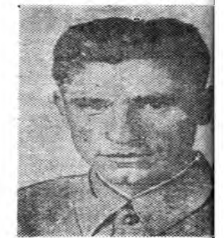
Жэлэйнгээ тоосоо сэг эрхимээр дүүргэһэн Тарбайчагай Больше-Куналейскэ советэй «Победитель» колбухгалтер.

рөвөцүүд оройдоо 1.500 хүдэлмэришадые Германи худар кара баагаар намжаа абаашаба.