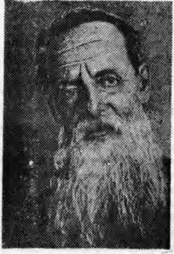
Уральска уранзохеолшо үлгэршэн П. П. БАЖОВ. (ТАСС-эй фотохроника).

Зохиолнуудаа нямэ адрэ эльгээхэ гөбөл: г. Улан-Удэ. ул. Ранжуров