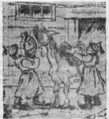
Ярууны аймагай Ворошиловэй нэрэмжэтэ колхозой «мори» гээшэ ха.

Г. БОРИСОВ, Хорин МТС-эй ахалагша механик.