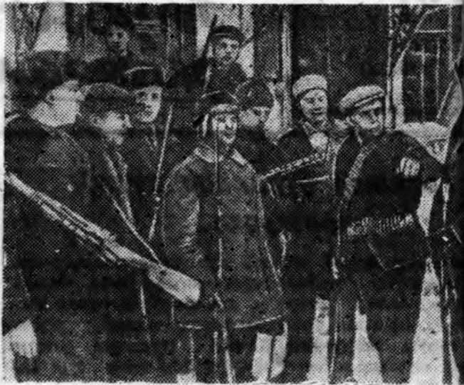
СҮЛӨӨЛЭГДЭҢЭН КРИВОЙ РОГ ГОРОДИШактёрско отрядай партизанууд түрэл городтоо бусажа байна.