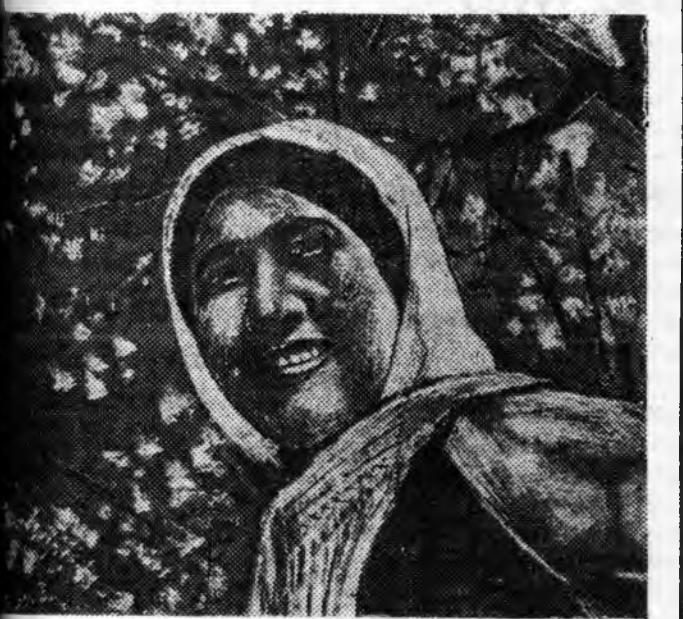
Шарипованай сөсөрлигүүд дэлгэржэ байна. Мүнөө жэлдэ эхэ үдэр ургаса абтахаар хүлээгдэнэ. Шарипованай Ворошиловай нэрэмжэтэ колхозой эвельевод ШАРИПОВА колхозойнгоо эсэсэрлыг соо байна.

Ф. ВОРОНЦОВ, ВКП(б)-гэй Прибайнальскэ айномой секретарь.