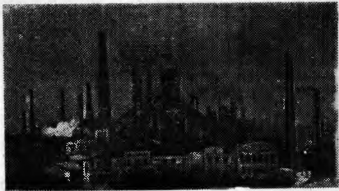
Евациевска металлургическа заводой домено цех.