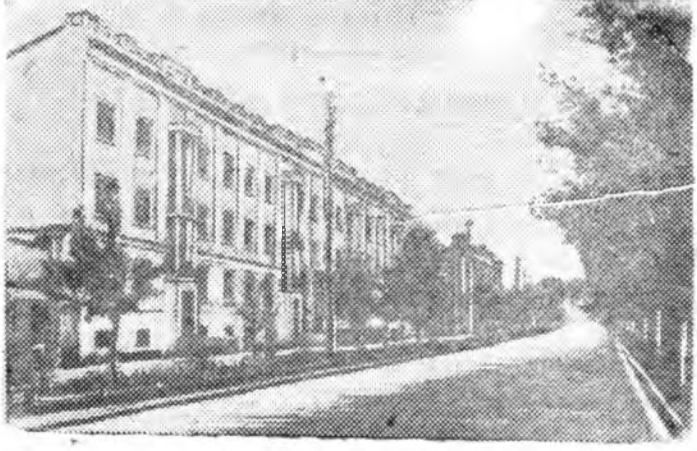
Улан-Удын специалистнуудай байшан