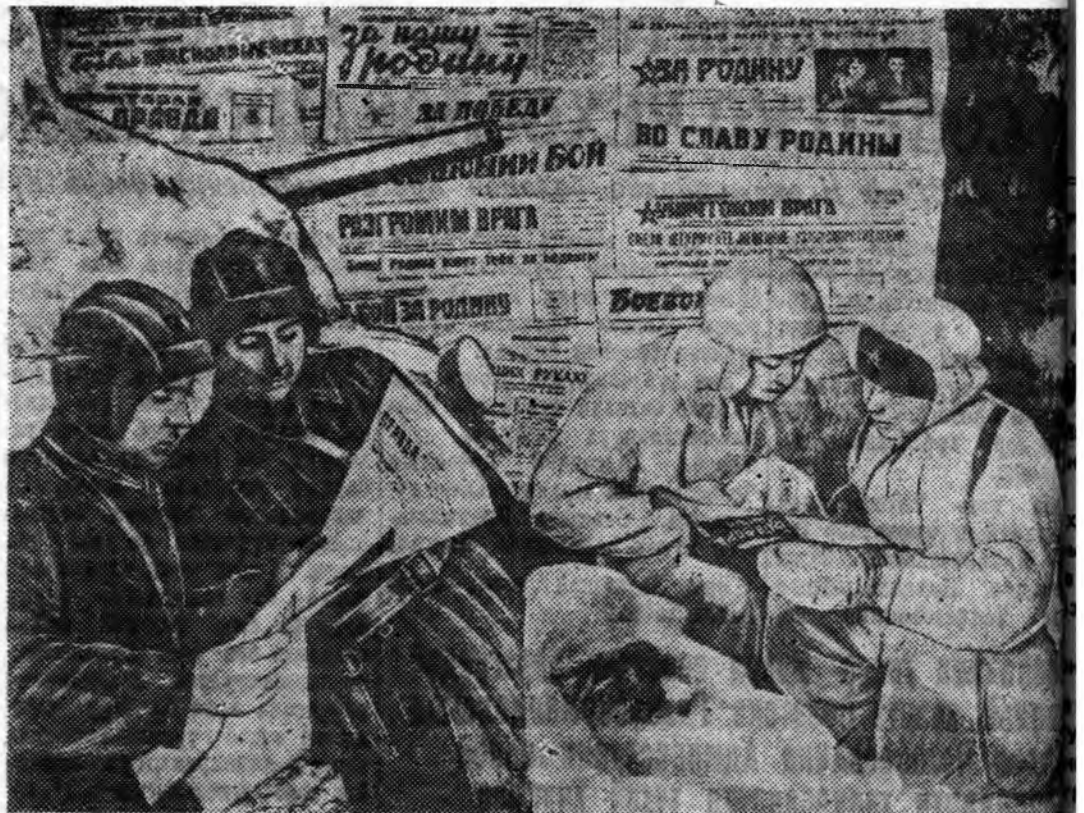
Большевицкэ хэблэл фронт дээрэ.

Энэ бодбол поли дээрэ гараһаннаа хойшо үдэрэй 1,50 гектар хахална. Үбгэрһэн колхозник Шестаковой энэ эрхим үүсхэлыг бэшэ колхознигууд дамжэжэ зэргэтэй. Ц. РОДИОНОВ.