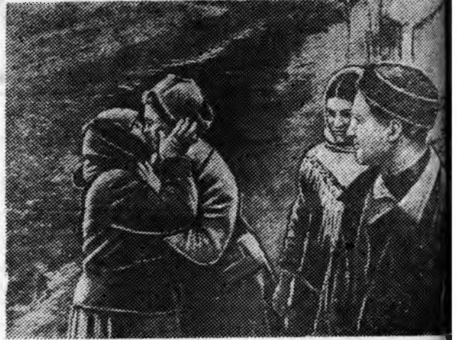
Немецүүдһээ Шибка гэжэ деревнин (Одесске область) сүдэнэй һүүлээр час болоод байхэда гүйлсэдэ зүрхэ худуулзалдаан болоо.

Д. НАМСАРАЕВ, ВВП(б)-гэй Бичурын айкомой пропаганда ба агитациин таһагыг даагша.