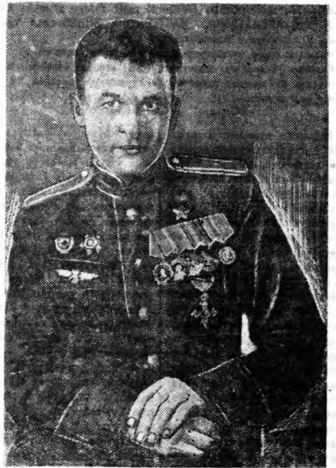
Летчик-истребитель Советскэ Союзэй Герой гвардия май- ор Василий Фёдорович Голубев гэгшэ Улаанутугта Балтикада суутай болонхой юм. Дайнай эжилхэнээ койшо энэ болбол 556 дахин дайшалхы нийдэлгэдэ гаража, «Ирэг 39 немецкэ самолёты унагаанан байна. Баатар зүрхэтэ сталинскэ сокол фронтгөө иползаархын болохо Ленинградска областивн Вол- ховско районой колхозникуудай захижа бүтээлгэнэц «Лавоч- кин—5» гэдэг истребительдэ нуугаад нийдэнэ. Гаяхан В. Голубев Москвада ержэ, тэрэндэ «Британска империи» IV-дэхи зэргын орден барюулагдаһан байха юм. Великобританин король Георг VI гэгшэ Улаан Армиин бусад сэрэг- шүүдтэй хамта тэрэ орденээр шэнэ зоригто дэгчигын шагна- һан байгаа.