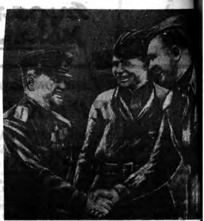
ЗУРАГ ДЭЭРЭ: Дайһы өмөлхөһөө хойшо дайсанай 50 лёдые угы хэһэн, хоёр дайһин Советскэ Союзай Герой бол Николай Гулаев (зүүн гарһаа) гэгшые төлөвүүд алаулат дашарамдуулан амаршалжа байна.

цүүдэй эсэргүүсэлтые нуга дараад, шэгэн зэргээр зүүн-хойто, зүүн ба зүүн-урда талануулаань гөрөдтө сүмэрэн өрөһон байна. Үглөнөөй 7 час хүртэр немецүүд Минскын зүүн хубилал сохигдон гараһан байгаа. Манай сэрэгүүд амжалтала хүгжүүлжэ Свислочь мурэнине гатаажа, хахад үдэр багта дайсанай гарнизонны бута нэрбэн балгааба. Советскэ сэрэгшэд советскэ Белоруссин столица, түмэр ба шоссейнэ харгынуудай шухала узел болохо Минск гөрөдые немецко-фашистска булимтарагшадһаа бүри мүнэн сүлөөлээ.