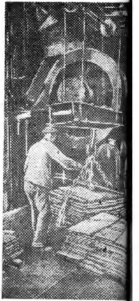
Дзержинскийн нэрэмжэ пропепровскэ завод дээрэ болдоогдоһон дунда эрхэ калта стад Украиньны болосоо ажаруулдгэригдэ цэ үгэжэ байһанай. ЗУРАГ ДЭЭРЭ: Бэлтэ циве сортировальжа байһанай.

Седлец гэдэг түмэрзамай узел дээрэ (Варшаваа зүүн урдуур) бомбодолго болоходо түймэрнүүд гараа. Сэрэгэй эбсэг хэрэгсэлнүүдтэй вагонууд болон зайдан вагонууд, мүн тэрэшлэн немецүүдэй сэрэгэй складуудшатаа.