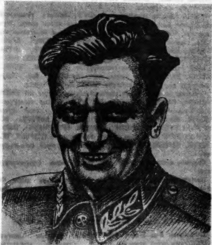
Югославин Арадай-Сүлөөлэлтын армийн главнокомандалагша маршал ИОСИП БРОЗ-ТИТО.