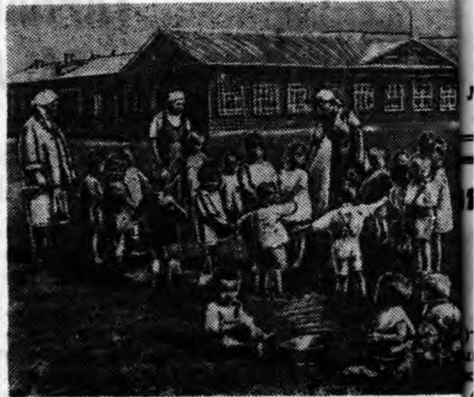
Сэлэнгын аймагтай Загастайн сомоной Сталиний эр колхозой хүүгэдэй ислита үхибүүд хандажа байна. Л. Половой

БУХАРЕСТ, сентябри 5. (ТАСС). Урдань Бухарестдэ германска элшэн түлөөлөгшэ һууһан Киллингер болон тэрэһэнэй секретарь байһан Петерсон гэгшэд бээс хорложо алаба гэжэ румынска телеграфна агентство дамжуулаа.