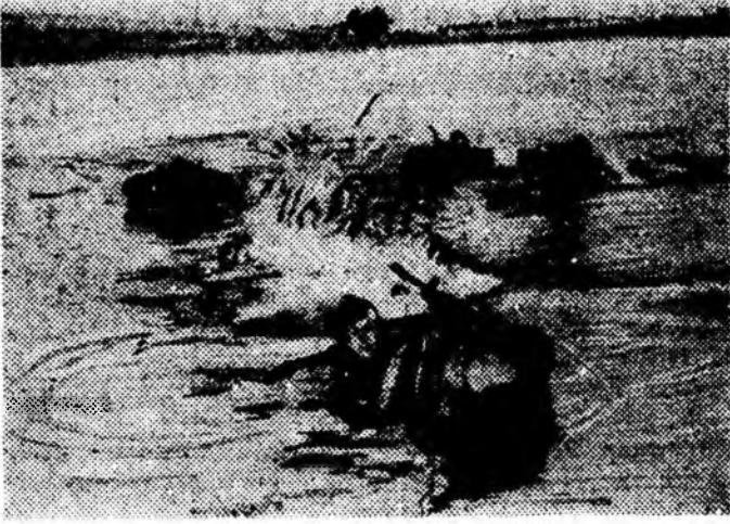
НЭГЭДЭХИ УКРАИНСКА ФРОНТ. Боецүүд плашпалаткаар үшэн рубежые паталон гаражи яһаа.