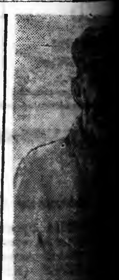
Занграйн аймгийн кын сомоний Оронго тэ колхозой член, таггүй эсэгэ С. С. Энэ үбгэн колхозой ябахадан ворной на.

Манай авиаци Штадлумен гэдэг түмэр замай станцида (Зүүн Пруссия) довтолгоо хэбэ. Станцины территория дээрэ ехэ ехэ түймэрүүд гараһан байна. Түмэрзамай эшелонууд болон горючптай нистерянууд галда шатаа.