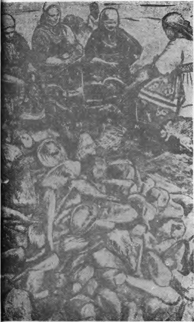
МАНЯЙ ЭНДЭ САХАРАЙ СВЕКЛО УРГАДАГ БОЛОО Улаан аймагтай «Красное знамя труда» колхоз болбол манай Удмурт дотор сахарай свекло ургуулжа ябадалда эхи татаба. артель шээгэ культурые хоёрдох жэлээ найнаар ургуулжа 100 гектар дээрхи свекло сахарай шээгэ заводые түүхэй р хүсэд хангана. РАГ ДЭЭРЭ: Нүхэр Утенковагай түрүү звеногойхид сахарай ро сэрблэжэ байна.