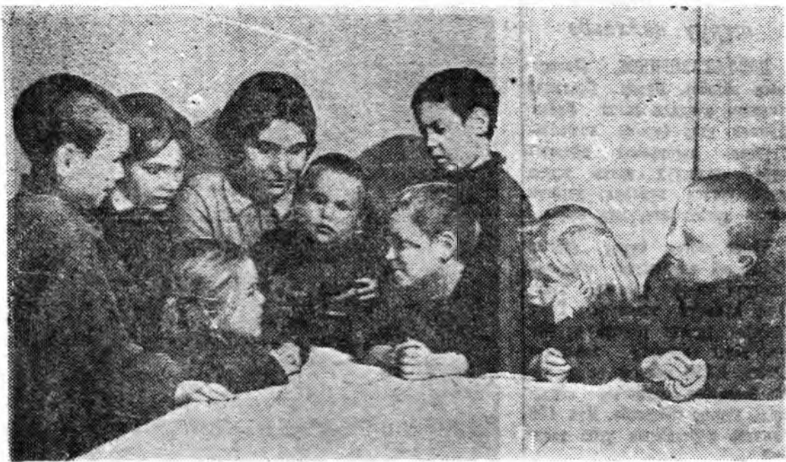
Горький гордто ажалууд фронттойг найман үйлдүүднэ хүмүүжүүлнэ. Босцын бүлэе гордой ололгын организацинууд анхрал ба оролдолгоор дүрэмнэ. Горсовет тэржидэ үнэ бэлэглэе.