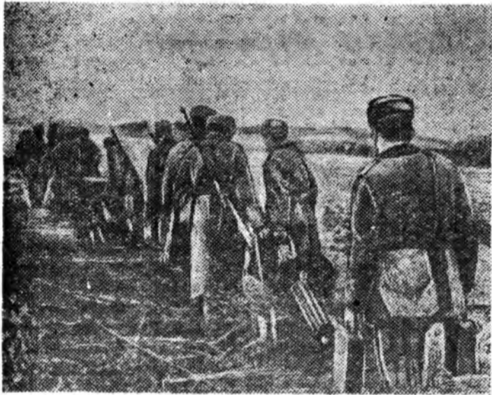
ДАЙЛАЛДАЖА БАЙГАА АРМИ.

Эдэ радиодамжуулгын сеть ба радиоузел байгуулха хэрэгтэ 30 мянган түхэриг табигдаба.