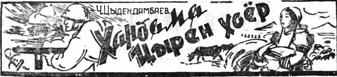
(Үргэлжлэл. Эхнийнх «Б. М. Үнэтэй» январийн 16, 17 ба 20-ой номернуудта).

Хүмүүндгүй мүнхэ хабсагай шэнгэ төбхшнэ. Шэрэм үүдэтэ бата шулуун Кремльдээ, Сэхэ ябажа орохой гэжэ ханагдана. Эрхэ сүлөөгөө хамгаалха гэжэ ербэнээ Эсэгэ Сталиндаа дуулгаһайб гэжэ ханагдана. Алтан туяата Кремлин оод ялэрнагүй, Агаарай тревога ходоо боложо ханхивана. Эзэрхот дайсадай зарим самолёдууд алдагдажа, Эндэ тэндэ галта божбонууд төлөртэ. Газар дэлхэйи нарата столица Москва, Галуу дайсадай хандаргажа мүнөө байхада, Халуун зүрхэнэй үсэд шанга сохидол соо Хатуу тангариг өөрөө зохиогдон түрэнэл даа. Эхэ эсэгэми, Хандама шлагни, мүнөөдөр Эсэгэ ороноо хамгаалхын түлөө ошохомнай Баяртай ушархын үрэл табни үзэгшэ Баябай ажин Ширен Хүбүүн бэээрээб! Хамта ябаһан басагад хомогаһын сугларжа, Хандаматала хамта байсан ойроч эогсонд. Сэхэл зүрхөө Абиата ахайхан амарһандаа Шөнивсэ тарлагаа баяртай боолгожо эхилнэ.