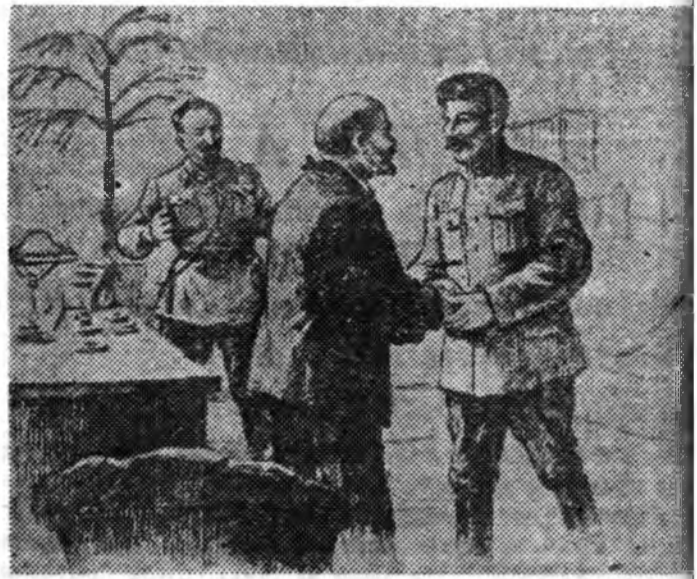
ЗУРАГ ДЭЭРЭ: «1918 ондо И. В. Сталин Царьпиньскэ фронтһоо ерөөд байхалаа В. И. Ленинтэй уулзажа байна». Урмызураг П. Васильевтэй зураһан «В. И. Ленин ба И. В. Сталин» гэгһэн альбомһоо репродукци).

В. ХОГОЕВА, ВМП(б)-тэй Улан-Удын горномой пропаганда ба агитацины таһагые дэргэша.