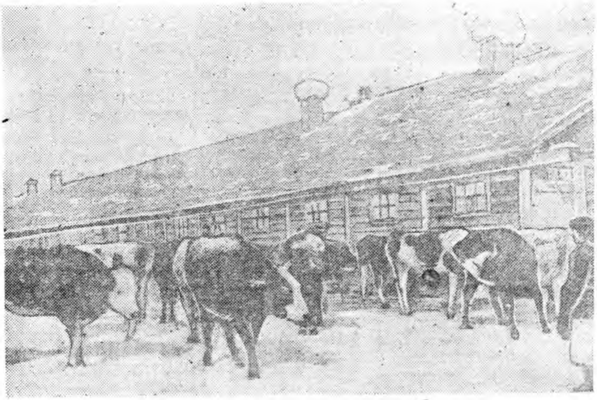
Иволгын аймагай «Улаан Оронго» колхоздо үүлтэртэ малнуудыё үбэлжүүлжэ байна. Зураг дээрэ: Колхозой малай байра.

малшадай хитэ ажал үсхэбэрлэхэ гүрэнэй дүүргэжэ, ашаг дээшлүүлхын түлөө аймагай Тельманей колхозой түрүү хаали- шангээр оролсонхой. малшал үбэлэй дентнер үбшэ тэжээл дуураа, бүхы малаа дуула тобир тарган байха юм. Дулаан хонюд садатараа үбшэнь үбэлшье наа байгаа. Һү наа- эндэхи хаалишад юер нара соо 101 үршэн байна. Гүүр- тэ абаад нэгшье ондо оруулжа бай- тугале даагша нүхэр малаа тобир тарга- оруулжа түлнүүдээ тэнжээхэ хэрэгтэ бүгэдэнь өлсүүлжэ зүбөөр эмхид- фермын хаалишан нүхэр Нимаева дээр дэлгэрхэн соци- мурысоондэ түрүү үгэе ээлжэ яба- рууналдаг 13 үнээн хүйтэнэй үедэ алдангүй гараба. тугалнууддаа тарганаар тэ- һу наалгана үлүү- гүлөө наамхай харууналданайн- оной хоёр нарын процент дүүргээ. зоотехникийн заа- бур бүхы малаа харуу- нээлүүлнэ. Мүн фермын хаалишан дурсагдагша ну- уналдаггүй. 1944 ондо орондо 7.167 лятр үлүүлэн дүүр- тэбэри болгон 169 юм. Мүн энэ үлүүлэн үлэмжэ най- байна. Мүнөө жэ- хоёр нара соо Һү 100 процент дүүр- байһан үнээд тугалнуудын бүгэ- найнтай. ОТФ-эй хонишон үнгэргинэ жэлдэ 233 хурга бүтэнөөр эндо оруу- нүхэр 574 хони байна. Үбэлэй 50 центнер үбшэ 1944 оной хү- дүүр нүхэр Дамба- урган, 10 килограмм түлбэри үгтэбэн үнгэргинэ жэл- халта үдэртөө 9.702 болоһон байна. Улаан Арчингаа үдэртэ тоһо, мяха, Һү үсхэ эсэсэй илалтын үгэе улам ойротуулхын Тельманей нэрэмжэтэ түрүү малшал нимээр байха юм. ГРИГОРЬЕВА.