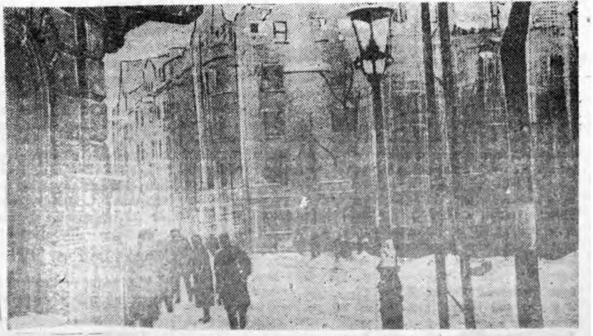
Нэгэдэхи БЕЛОРУССКА ФРОНТ. Улаан Армаар бүлөөлөгдөһөн ПОЗНАНЬ городой центральнэ үйлснүүдэй нэгэнинь.