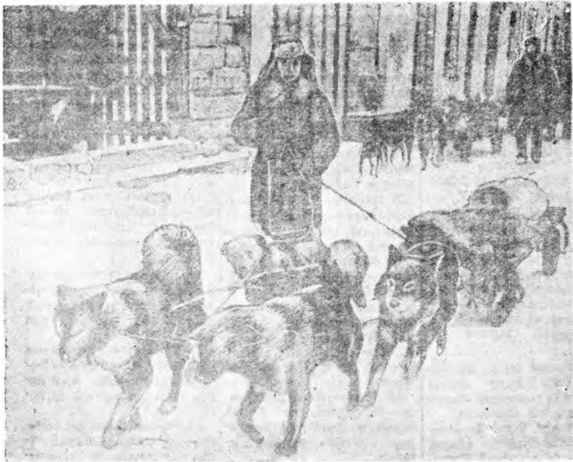
НЭГЭДЭХИ БЕЛОРУССКА ФРОНТ. Шалгада хүлэгдэнэ саяитарна нохойнууд түрүү по Е. КОПЫТЫН фото (ТАСС-эй фотехронико).

Мүнөөдөр кино-театруудта кино «ПРОГРЕСС» «Нэгэ басаган байһан юм» кино «ЭРДЭМ» «АРИНКА» Үдэшын 4, 6, 8, 10 час эхилхэ