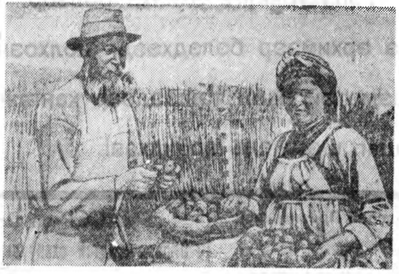
Тарбагатайн аймагтай Кировэй нэрэмжэтэ колхоз орофотго культурууны тархад, хартаахаа нүүлгэ жа наар дүргэхэн. 75 найгатай Григорьев Владимирч Иванов (шанары шалгатма) болол яровнзай хэвчэн хартааха сайнхан гэж тариха тухай Т. А. Ивановда хэлэж байганинь энэ зураг дээр рэвээ харанат.