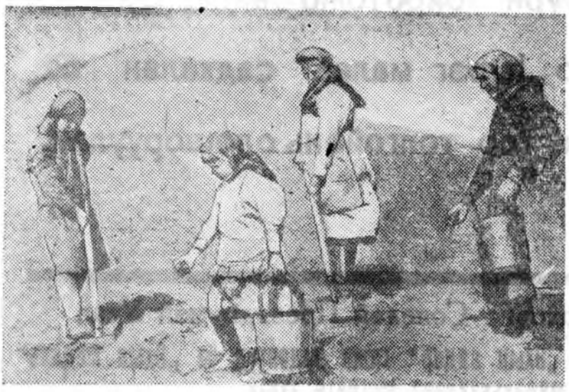
Тарбагатайн аймагтай «Красная Заря» колхозий гэрэй эзэн эхэнэрүүх ба үхитүүг хартааха сая сооь тарихын тула оролдсогтойоор оролсо.