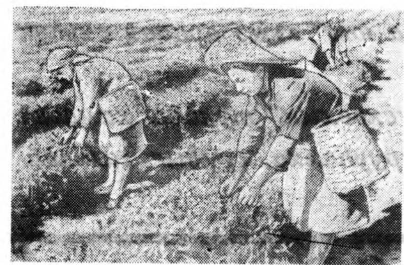
Абхазска АССР-эй Гуьлрипшскэ районий Махарадзын нэрэмжэтэ колхозодо сайн набахануудые суглуужа байна.