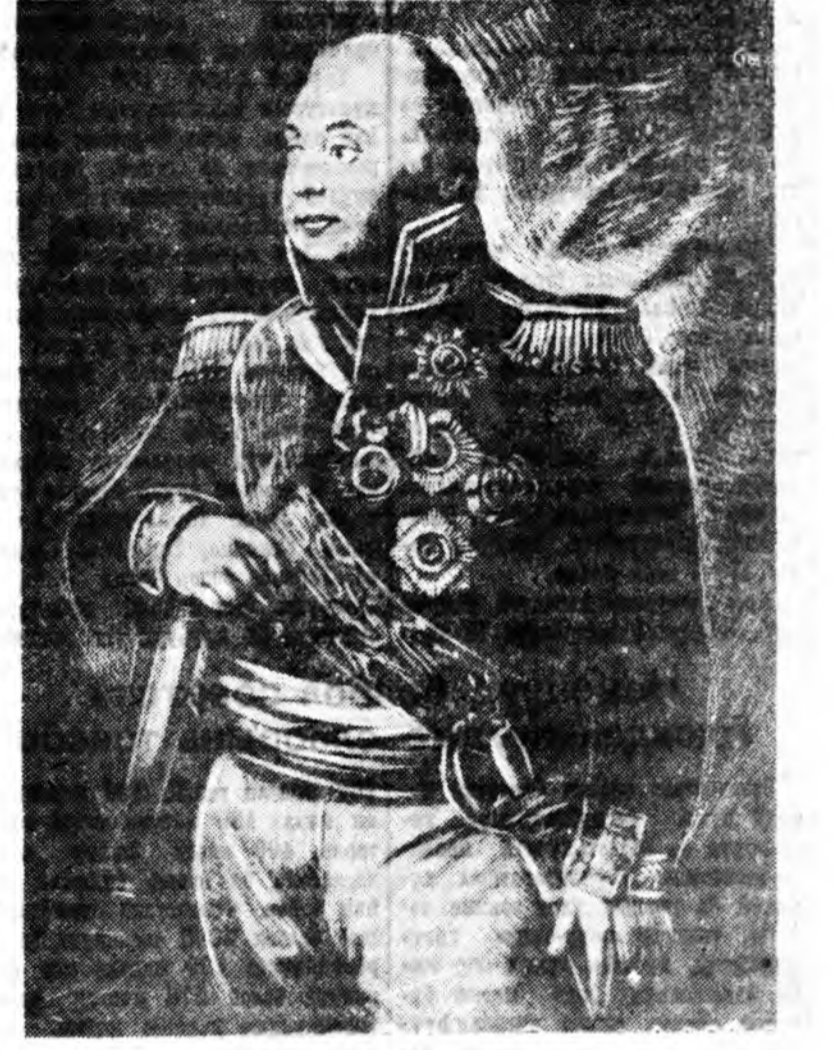
Михаил Илларионович Кутузов. Волковой портретнээ Гоббин хэвн гравюра. (Москвадахы гүрэнэй историческэ музейн материална).

Монастырнууд, церковьнүүд, костельнүүд, синагогууд болон шажан мүргэлэй бусад учрежденинүүдыг хандаргалга ба тонолго