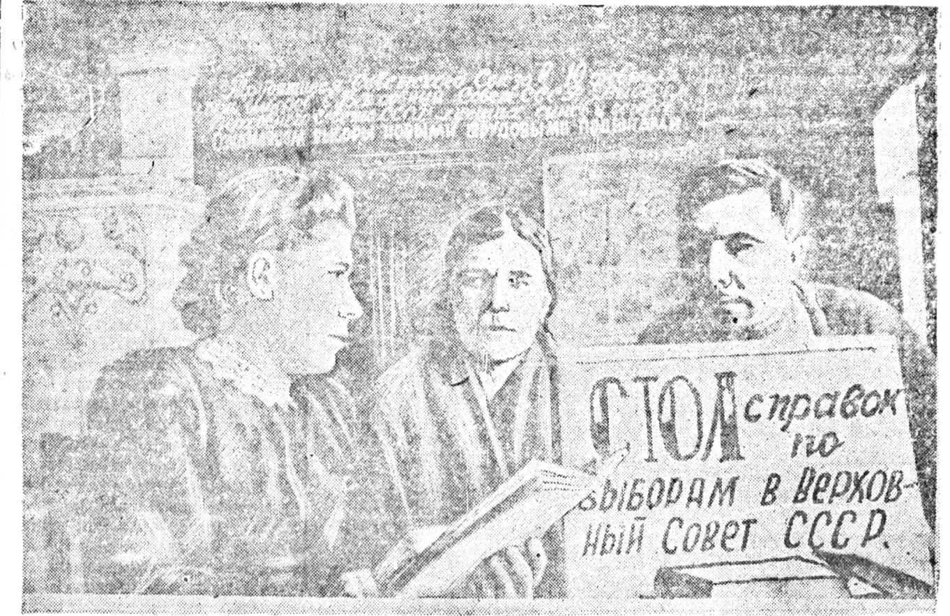
Ивановска областин Южскэ районой «Сорепователь» гэжэ хүдөө-ажалай артелиин колхознигууд байхан өөһөнгөө зөөрөөр тэн эхэлхэ шэнэ клуб баруула. Клуб дотор булгуули тухай тайбары үгэхэ стол амхидхадан байна.

В. ГЕРАСИМОВ, Сэлэнгын аймгай XVIII партбээрдын нэрэмжэтэ колхозой луговод.