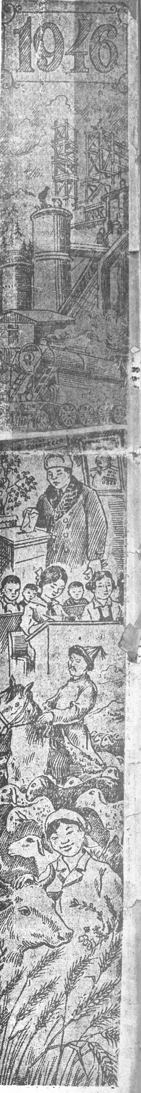
Арадуудай жаргалай наймагтай тулгуур Аркуун түрэл Оромнай, алдаршмш! Арадай алтан туг, советскэ нангин туг, Илаалтааа наалтада хүтэлшм!