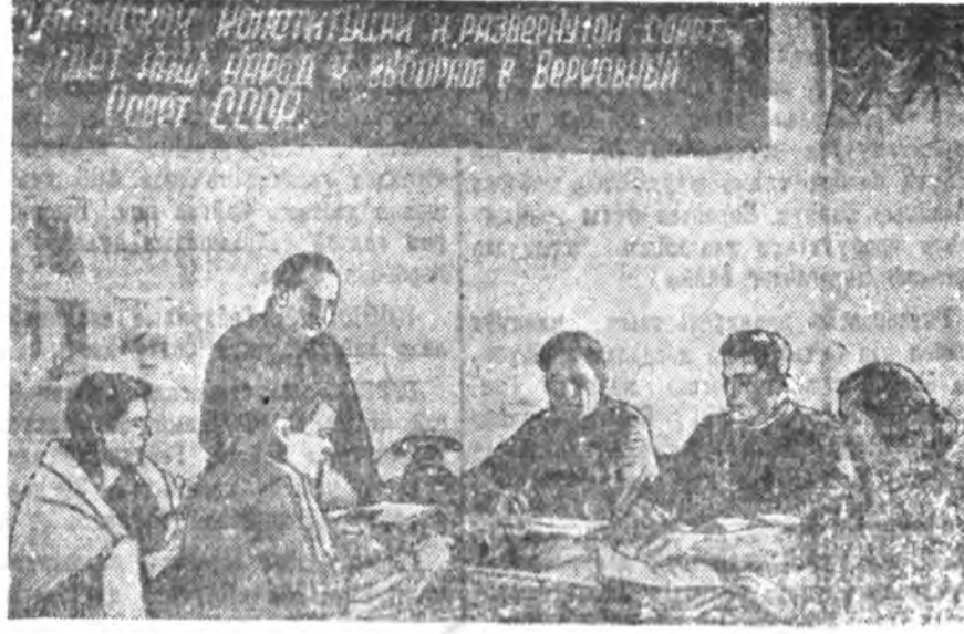
2. Эмэ участогай комиссиң членүүдэ элжээтэ зүблөөгө хэжэ байһан үе.