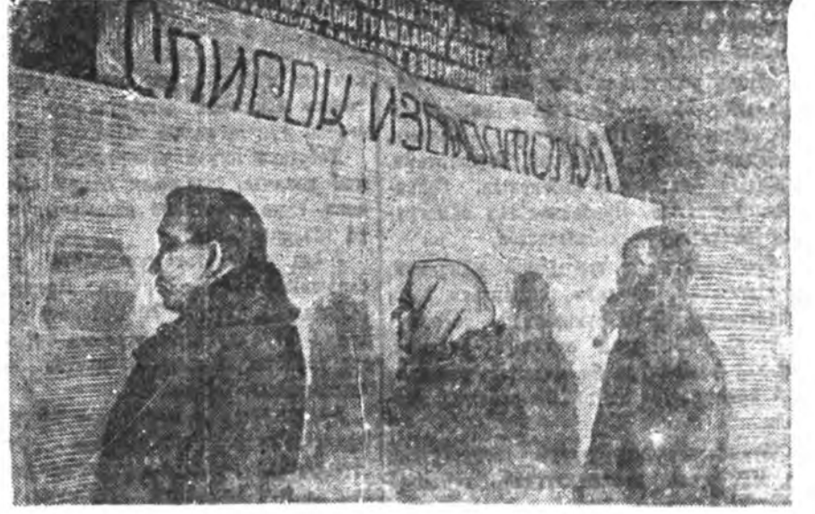
3. Хунгагшах өөһдөнгөө мэрэ обог шалгажа байна.