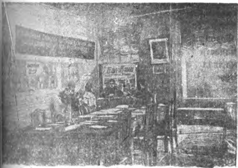
Хунгуулин 7-дохи участогай байсан соо ороходо нима байна.