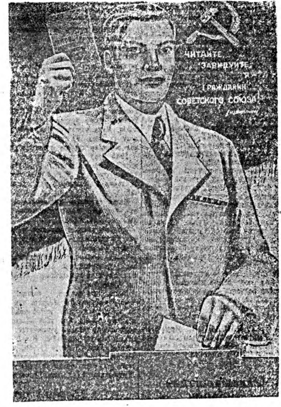
ЧИНГАЙТЭ, ЗАРИНЧИЙТЭ, ГРАЖДДАНИ, СОВЕТСКОГО СОЮЗЫ