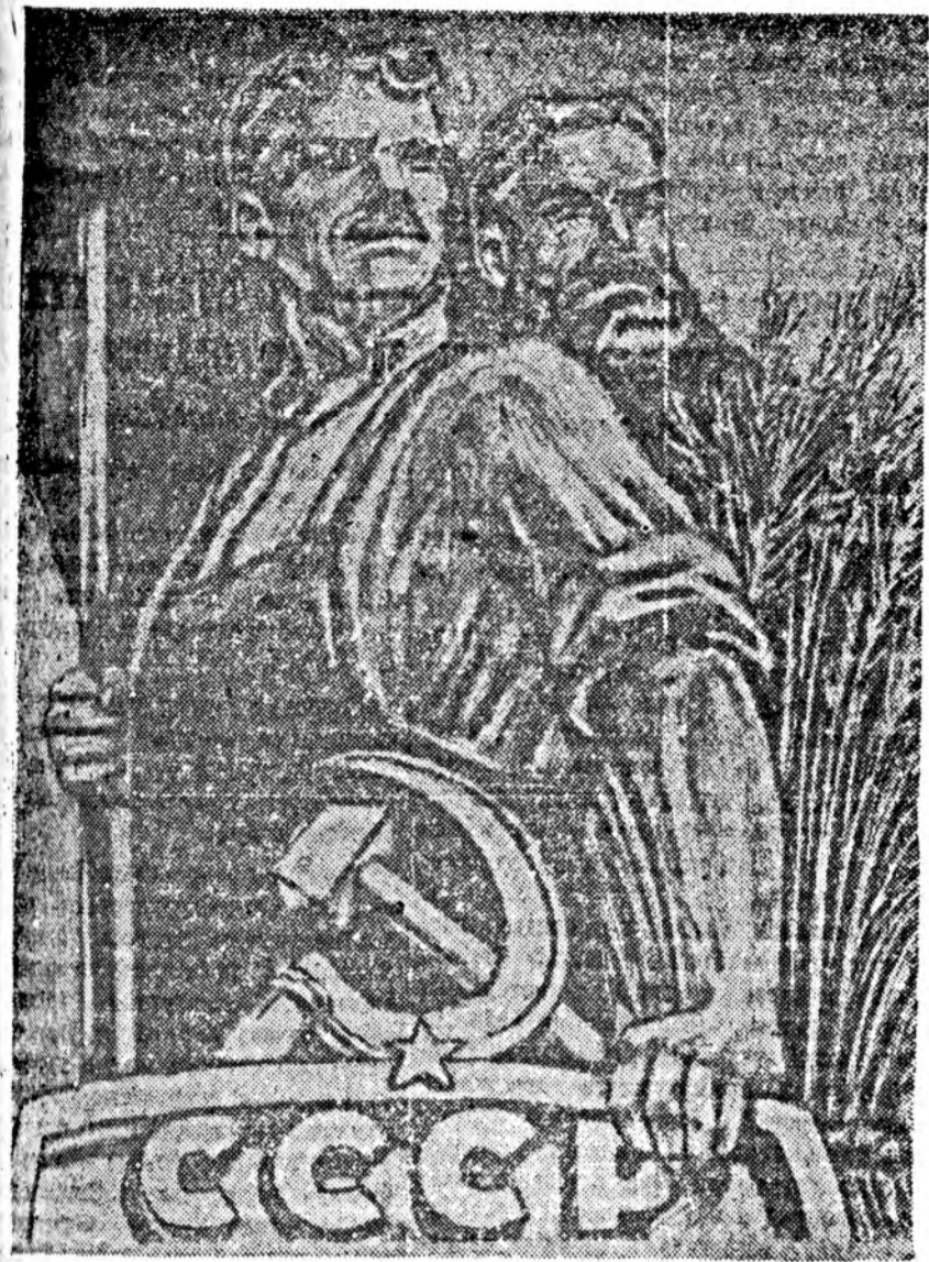
СОВЕТСКО СОЦИАЛИСТИЧЕСКО РЕСПУБЛИКАНУДАЙ БОЛБОЛ ХУДЭЛМЭРИШЭН БА ТАРЯШАНАЙ СОЦИАЛИСТИЧЕСКО ГҮРЭН МҮНЧ.