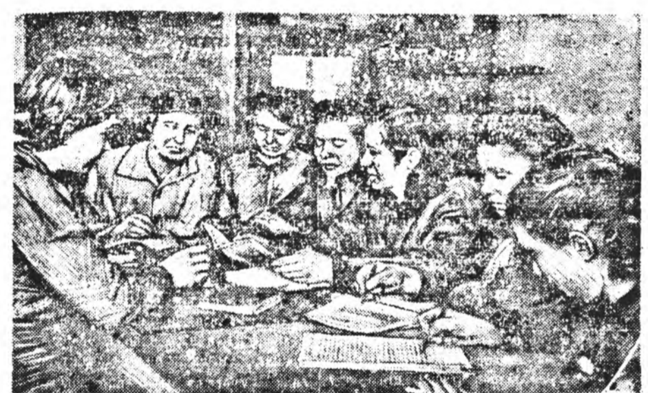
Курска областий Лыговско МТС-эй... Мүнгэ тоолохо машина...