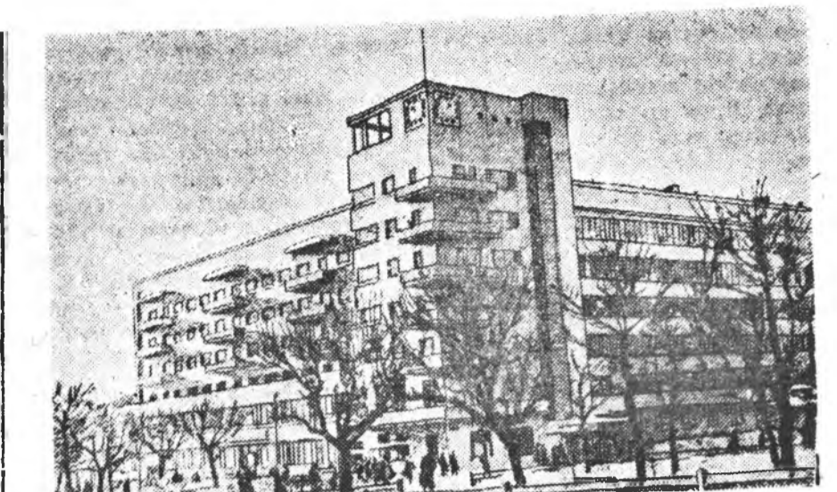
Советскэ Сөөдэй гөрөдуудгар. Новосибирскдэй Улаан проспек дээрхи байрын гэр.

Ревдинскүүд өөндөхтөө үгэхэ хүржэе байна. Март харын үнтерөөн 26 хонж-соо тэжээр 880 тонно булад, 100 тонно прокат, 350 тонно проволоко энэ фондо үгэхэ.